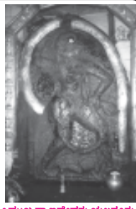
ಶ್ರೀ ಮುಖ್ಯಪ್ರಾಣದೇವರು ಯಲಗೂರು