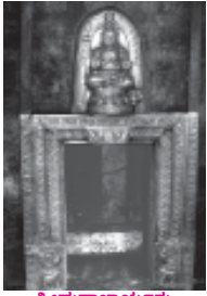
ಶ್ರೀಮದಾಚಾರ್ಯರು ಅಧ್ಯಕ್ಷವಾದ ಸ್ಥಳ ಉಡುಪಿ