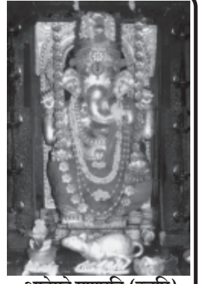
आनेगहे गणपति (उडुपि)

भाद्रपदमास दक्षिणायन वर्षाऋतु सेप्टेंबर-अक्टोबर