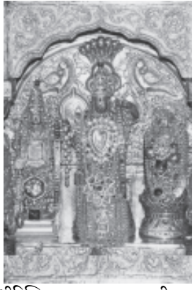
श्रीदिविजयराम मूलराम मूल सीता