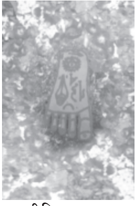
श्री विष्णुपाद गया